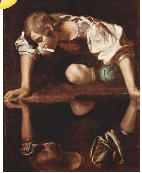
Narciso en la fuente. Óleo en lienzo atribuido a Caravaggio.